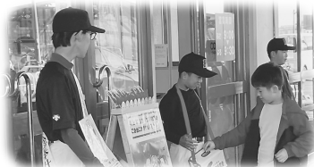
《街頭募金：釧路リトルシニア》