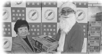
《歳末寄贈：コカ・コーラ》