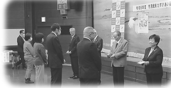
《歳末：助成金交付式》