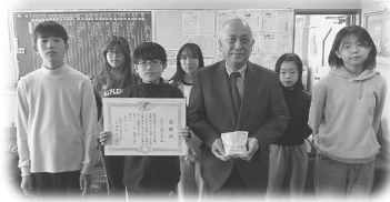
《学校募金：朝陽小学校》