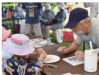
▲釧路市阿寒町ふれあい広場