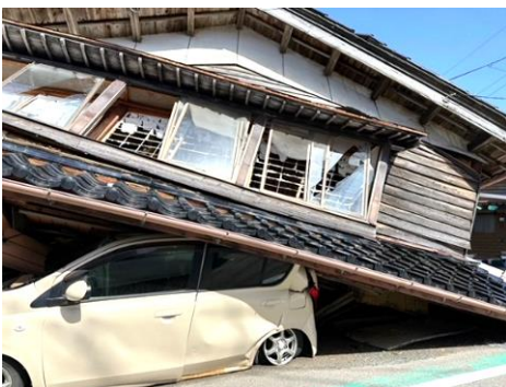
【一階部分が潰れた家屋】