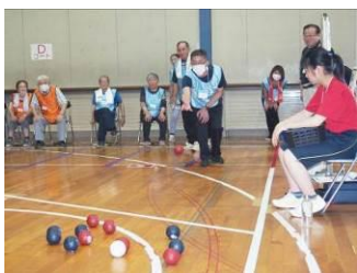
▲阿寒地域福祉大運動会