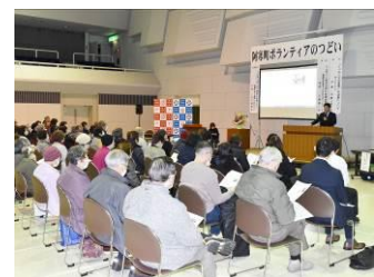
▲阿寒町ボランティアのつどい