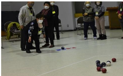
▲阿寒町ボランティア連絡協議会 会員研修交流会

阿寒支所では道具の貸出やボッチャの説明を行いますので、「地域の行事等でやってみたい！」と希望がありましたら、お気軽にご相談下さい。