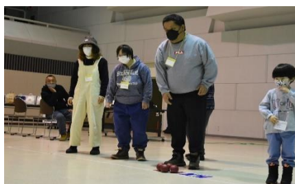
▲阿寒町手をつなぐ育成会 親子お楽しみ会