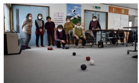
▲旭町町内会婦人部 寿の会